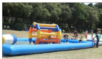
Les structures gonflables prendront place sur le pré du moulin Saint-Pierre.

Renseignements : comite-des-fetes.taillades@gmail.com ; 06.62.29.51.16 ; 06.09.15.15.25.