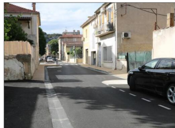
L'avenue Stalingrad fait peu neuve.

notamment une mise aux normes PMR de la voie. Le coût du chantier s'élève à 751 474 euros, financé à hauteur de 335 413 euros par la Ville et de 398 061 euros par la communauté d'agglomération Luberon Monts de Vaucluse. NEO travaux et Midi Travaux étaient en charge de la réalisation de ces travaux.