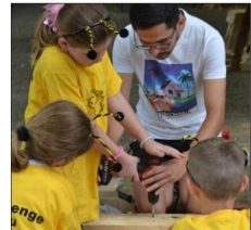
La construction d'un nichoir par un groupe de Pertuis.

Bosque, centre de loisirs de la ville d'Apt, a accueilli huit centres du sud et nord Luberon ce mercredi 8 juin à l'occasion de la journée d'échange et de rencontre pour les jeunes du Luberon. Situés dans le Parc naturel régional du Luberon, les accueils de loisirs sans hébergement, fédérés en réseau sous l'égide